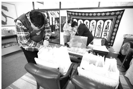
取材先団体の活動風景を撮影(2021年4月)