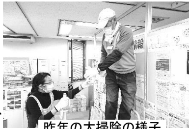
昨年の大掃除の様子

3月28日(火)に市民活動推進センターの大掃除を行います。また、2月18日(土)のサポートクラブ運営ミーティングでは、大掃除の事前準備の話し合いを行います。登録団体やサポーターの皆さまに気持ちよく使っていただくために、ご参加・ご協力、よろしくお願いします。