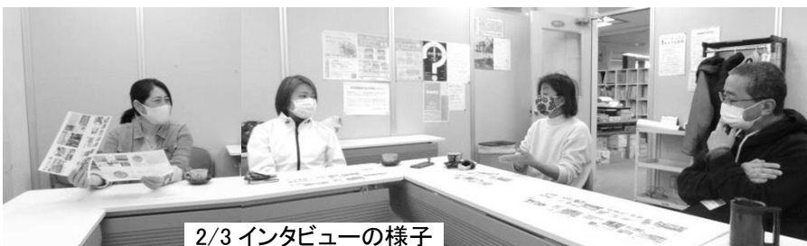
2/3 インタビューの様子