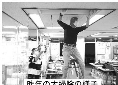
昨年の大掃除の様子

3月28日(火)に市民活動推進センターの大掃除を行います。2月18日(土)のサポートクラブ運営ミーティングで、掃除の内容を決めました。たくさんの方にお手伝いいただきたいと思っております。よろしくお願ひします。