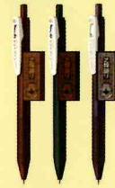
サラサクリップ 3本セット 描きおろし 880円(税込)