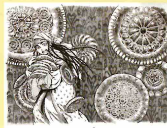
複製原稿 B4 各1,430円(税込) 複製原稿 見開き 各1,980円(税込)