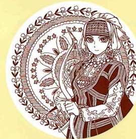
プレート 全1種 描きおろし 1,650円(税込)

描きおろしイラストを使用したグッズや緻密な作画を活かしたグッズが40点以上!ラインナップは公式サイトをチェック!関連グッズを税込3,000円お買上げ毎に、ネームリーフレット1枚進呈します!(全5種ランダム配布、無くなり次第終了)※画像はイメージです。デザインは変更になる場合がございます。