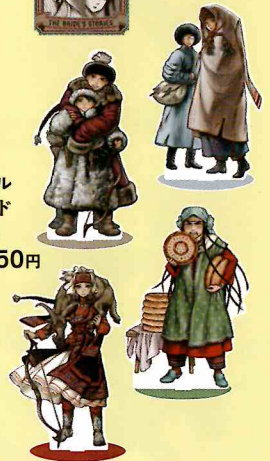
アクリル スタンド 全4種 各1,650円 (税込)