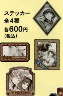
ステッカー 全4種 各600円 (税込)