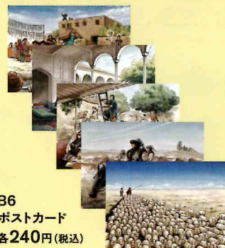
B6 ポストカード 各240円(税込)