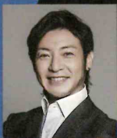
ふじさわ観光親善大使 つるの 剛士さん