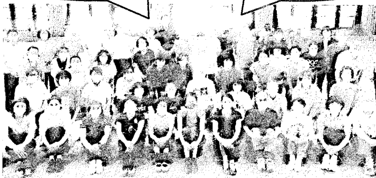
令和4年度受講者の皆さん さまざまな場所で活動されている皆さんが参加されました