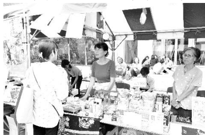
復興物品販売(2019 秋葉台会場)