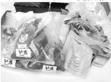
団体の物品販売(2010 駅前会場)