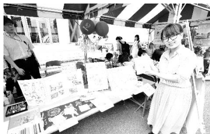
団体紹介ブース(2019 秋葉台会場)