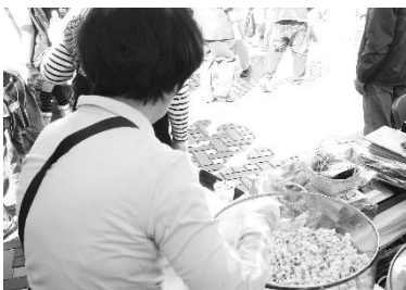
ポップコーン配布(2010 駅前会場)