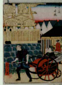
三代歌川広重 「五十三次 日本橋」