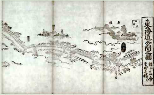
遠近道印・菱川師宣 「東海道分間絵図」(部分)