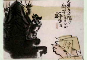
岡本一平・他 「東海道五十三次漫画絵巻 日本橋」