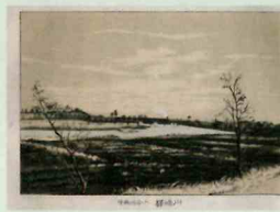
亀井竹二郎・大山周蔵 「懐古東海道五十三駅真景 川崎」