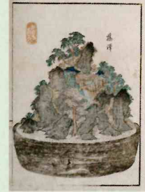
歌川芳重 「東海道五十三駅 鉢山図絵 藤沢」