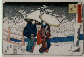
二代歌川広重「東海道五十三次 七 藤沢」