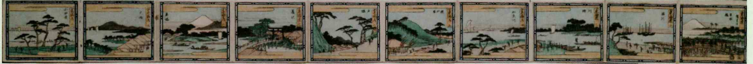
歌川広重「東海道」(山庄版)抜粋