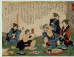
仮名垣魯文・落合芳幾 「東海道中栗毛弥次馬 藤沢」