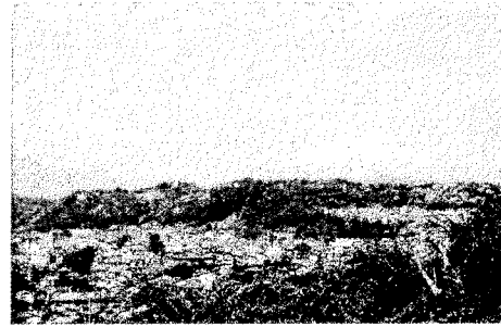
城山公園展望台からの富士山

☆アクセス 旧吉田茂邸地区 はJR東海道線大磯駅より「二宮駅行」「湘南大磯住宅行」バス乗車9～10分、城山公園前下車すぐ。 城山公園 は旧吉田邸より徒歩3分。 （☆裏面の地図と時刻表を参照 ☆駐車場は両地区とも平日は無料）