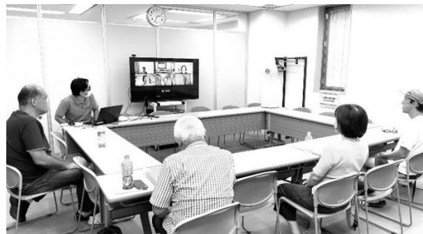
運営ミーティング(8月)の様子