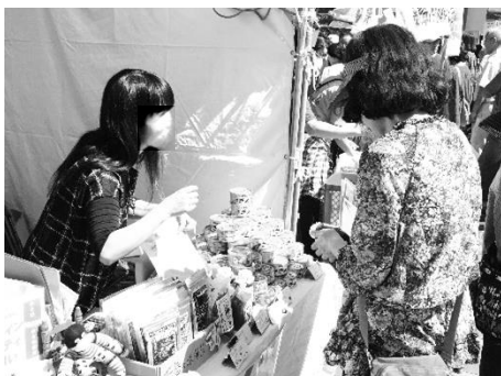
商品説明・接客対応(2014)

お申込みはメール、またはお電話で、①お名前、②ご希望の活動時間、をお伝えください。活動時間は、日付と(イ)9:00～13:00、(ロ)12:00～16:00、(ハ)14:00～18:00 の時間帯からお選びいただくか、具体的なお希望時間をお伝えください。「にぎやかに集まるブースづくり」にご協力よろしくをお願いします。