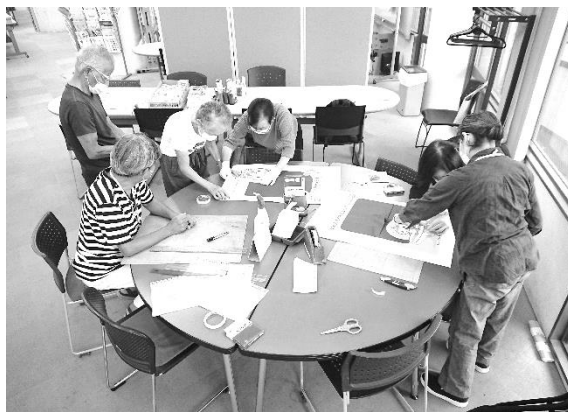
昨年の市民まつり準備の様子

また、表ページ「(C)団体 PR 動画の上映」に記載されている「15秒団体紹介動画」ですが、「サポーターの活動動画」を作成します。ブースの準備をされている様子やサポーターの皆さんが元気に活動している様子を動画撮影いたします。