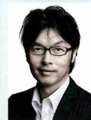
クージュ株式会社 代表取締役/ タリーズコーヒー ジャパン創業者 松田 公太

※各審査員のプロフィールは、ホームページでご紹介しています。(審査員肩書きは、2023年9月1日現在のものです)