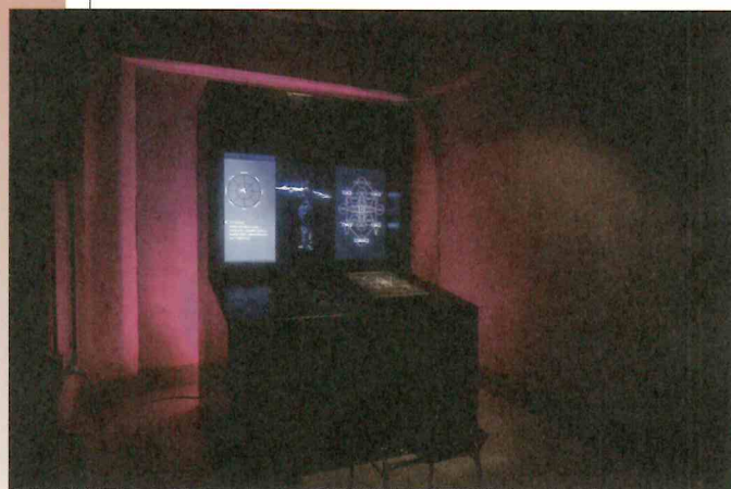
宍倉志信《Cyber Reincarnation Seminar》2021年