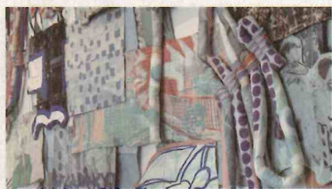
《ナラティブとダイアログ》(部分)2023年

神奈川県生まれ。2023年多摩美術大学美術学部生産デザイン学科テキスタイルデザイン専攻卒業。2022年グラスゴー芸術大学（交換留学）。主な展示に、2023年2人展「ゆめごっこ」（ギャラリー懐美館／東京）、多摩美術大学卒業制作優秀作品選抜展（多摩美術大学アートテーク棟）、国際共同教育プロジェクト connecting wool（ノルウェー大使館）など。「対話」について考え、テキスタイルを使った半立体作品やインスタレーションを制作する。人やもの間で起こる相互作用を捉えるように形にしていく。