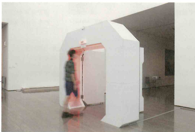
吉田裕亮《監房装置特別病室を出口に設置する》2021年