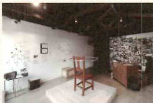
《土星プロレス》2018年

東京都生まれ。2017年東京藝術大学大学院美術研究科先端芸術表現専攻修了。主な展示に、2018年グループ展「明け方の計略」（駒込倉庫／東京）、2018年「黄金町バザール 2018」（神奈川）、2021年「紀の国トレイナート2021」（和歌山）など。企画した占いワークショップに、2022年「碇の旅打ち」（脱衣所／東京）。2016年「ゲンビどこでも企画公募 2016 藤本由紀夫賞」（広島市現代美術館／広島）受賞。現在、茨城県で古文講師や地球儀の加工の仕事しながら、「病院・刑務所・墓場に行き場がないものたちの管理人」という肩書きで独自の占いによる制作活動をしている。