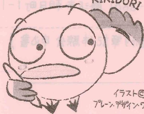
イラスト © プレインデザインワークス