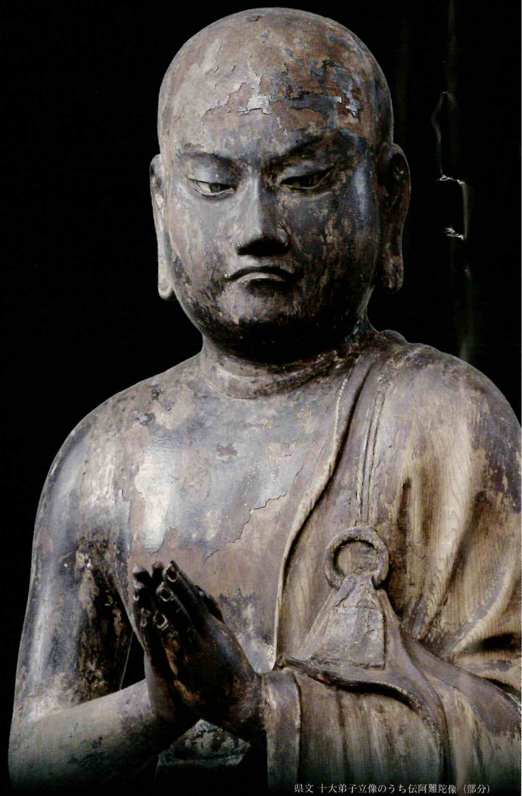
県文 十大弟子立像のうち伝阿難陀像（部分）