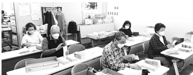
封入、ありがとうございます

毎月ご協力いただいている F-wave の封入ですが、1月は10日(水)に実施致します。毎月8日頃に実施しておりますが年始のため日程が異なります。1月10日(水)ですのでご注意ください。