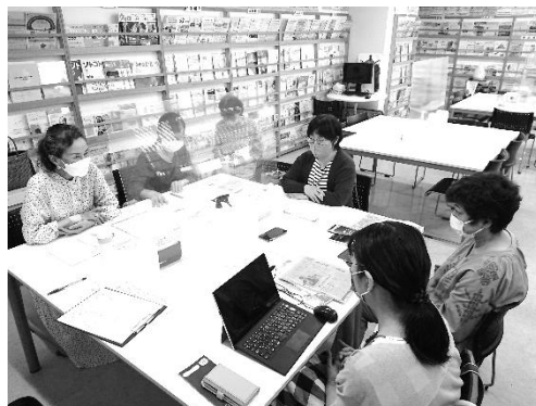
インタビューの様子(#つながる朝顔プロジェクト)