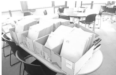
サポーターによる封入された封筒