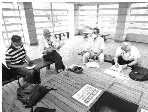
インタビューの様子(帆船やまゆり保存会)