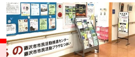
市民活動プラザむつあい