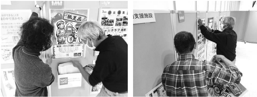
前回のパネル設置の様子