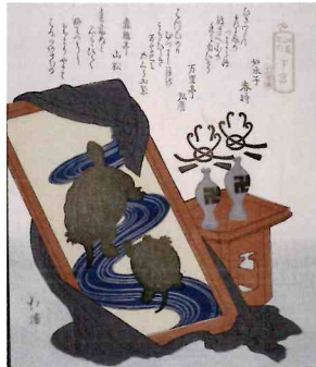
魚屋北溪「江島記行 下宮」