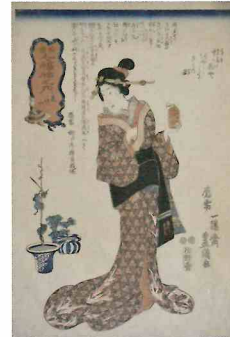
歌川国貞(三代豊国) 「誹諧七福神之内 毘沙門」