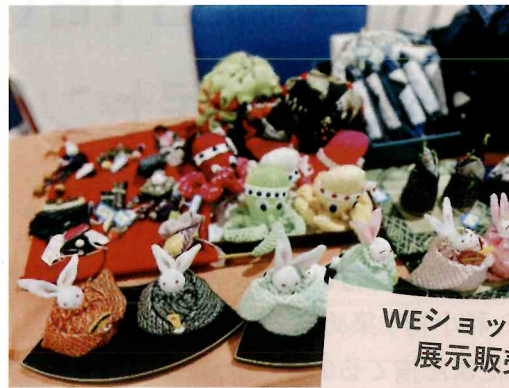
WEショップ・リメイク 展示販売コーナー