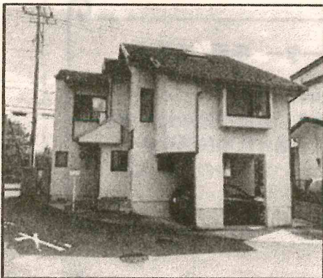
まちづくりハウス みろくじ

そこで今回は、実際に空家を利活用して事業を展開している団体とその空家の管理者にお集まりいただき、活動場所があることにより実現できた事業、地域との連携、施設利用上の課題などについて、トークセッションという形式で自由に意見交換をしていただき、事業のあり方や今後の方向性などについて『経験者だからこそ知り得る現状』を基に、これからの空家利活用を考えてみたいと思います。