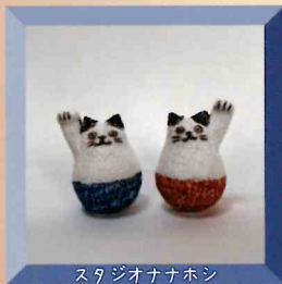
スタジオナナホシ