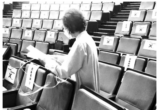
昨年のスピーチ大会での準備の様子

今年は昨年を超える400名の来場を予定しており、会場設営や誘導、受付対応、片付けなどのサポートしていただける方が必要です。ご支援をお願いします。