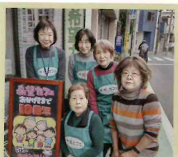
コミュニカフェに関わる活動