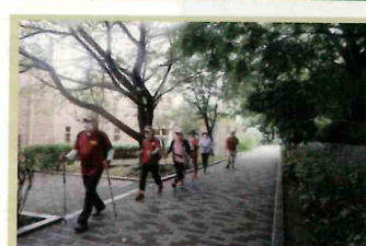
ポールウォーキングコーチ活動