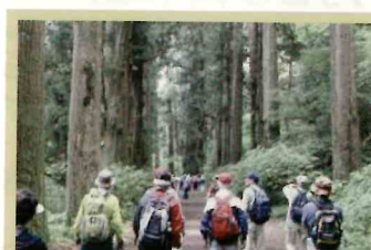
自然、歴史、文化を訪ねる

このほか 各種サークル活動や 地域で情報交換定例会など、 幅広く活動しています。