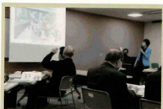
地域の講座講師活動