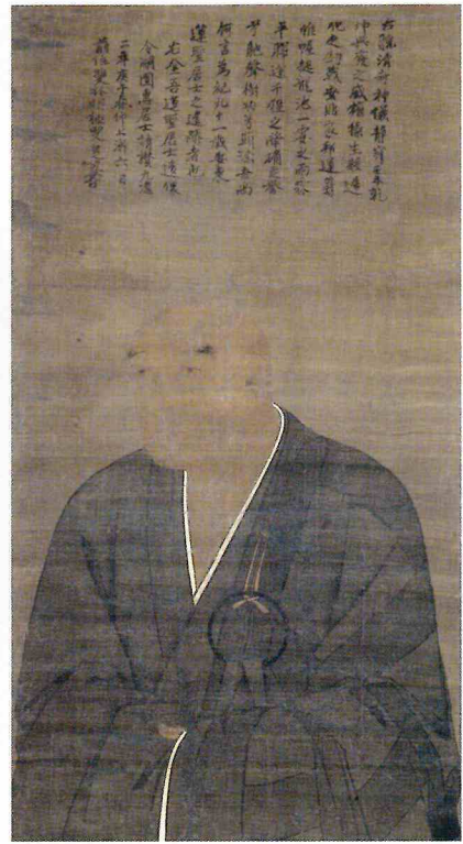
重文 安東蓮聖像 鎌倉時代 久米田寺所蔵