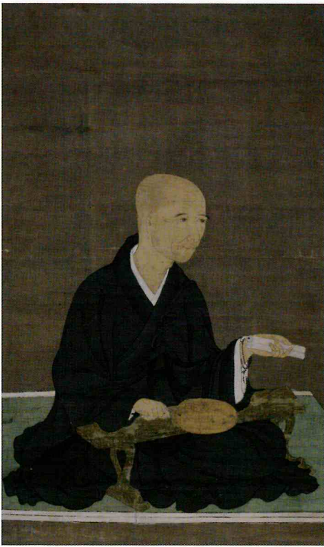
明恵上人像 南北朝時代 久米田寺所蔵