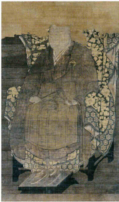
伝湛睿和尚像 南北朝時代 称名寺所蔵