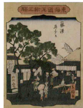
二代歌川広重 「東海道五拾三駅 藤沢 追分道」

浮世絵師の中には、著名な師匠の名を受け継ぎ、二代目、三代目を名乗って活躍した者が多くいました。二代目を襲名するという事は、歌舞伎役者と同様に、師匠の名声や技術を受け継ぐばかりでなく、さらなる飛躍が期待されることでもあります。