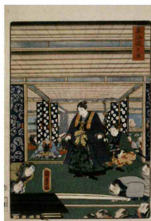
二代歌川国貞 「東海道 戸塚」

本展では、二代目浮世絵師たちが描いた藤沢ゆかりの作品を展示します。師匠の絵と比較しながら、襲名絵師たちの個性や奮闘ぶりを存分にお楽しみください。