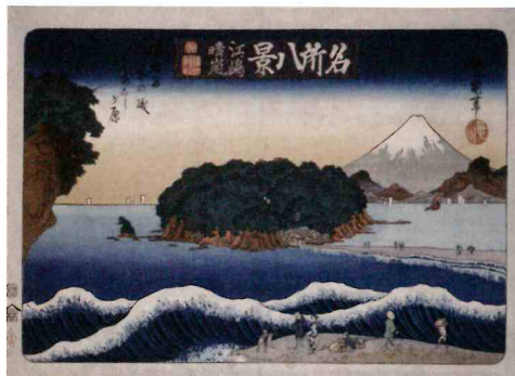
二代歌川豊国「名所八景 江ノ嶋晴嵐」