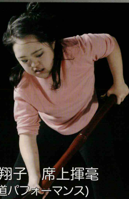
金澤翔子 席上揮毫 (書道パフォーマンス)