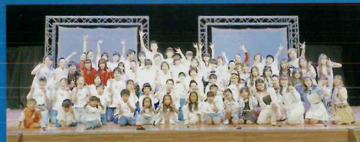
UD DANCE SCHOOL

世界最大級のオーディション番組「アジアズゴットタレント」にて大絶賛された日本のフィンガーパフォーマンスグループXTRAP。 Facebook 動画4000万回再生を突破した「指の万華鏡」を代表に次世代のダンスアートが世界で拡散される。「嵐にしゃがれ」「めざましテレビ」「スッキリ」など30番組以上で特集され 国内外のテレビ番組で話題となる。近年では、東京都参議院選挙CM 出演や、福山雅治 新曲「妖」ミュージックビデオ出演、乃木坂46 ライブ振付などCM、TV、アーティスト振付にと、多彩に活躍する。