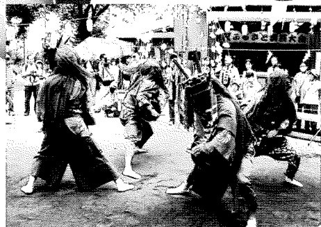
おおしま す わ みょうじん

移りゆく時代の中で、地域に暮らす人々に代々受け継がれてきた音楽や踊りや芝居などがいま、見直されています。神奈川県には、山村、農村、そして市街地にも、さまざまな民俗芸能が伝承されてきました。古くから土地に伝えられ、また移り住んだ方々の、忘れがたい故郷の舞踊など、豊かな神奈川県の文化遺産の中から、三つの芸能をご紹介します。