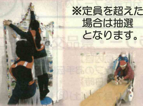
昨年のボランティア活動の様子