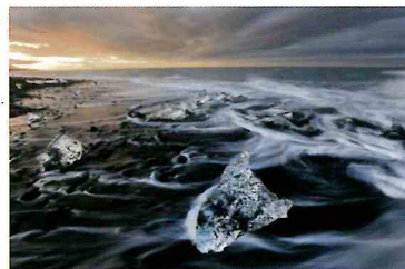
ヴァトナヨークトル国立公園[アイスランド]2018年