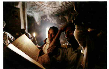
聖書を読誦する司祭たち 2012年