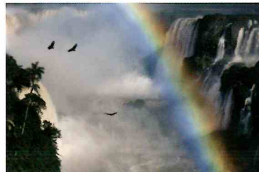
イグアス国立公園[アルゼンチン・ブラジル]2018年