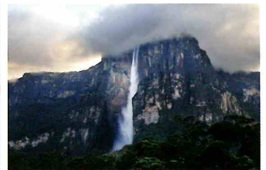
カナイマ国立公園[ベネズエラ]2020年