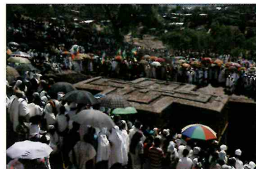
聖地ラリベラの岩窟教会 2010年