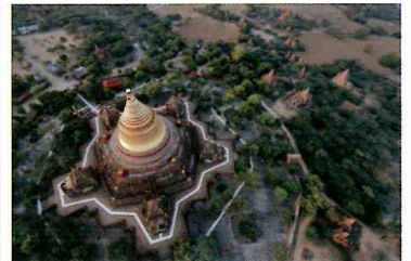
バガン遺跡[ミャンマー]2020年