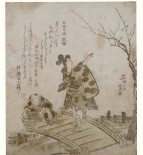
窪俊満「鎌倉志 荏柄天神 歌橋」