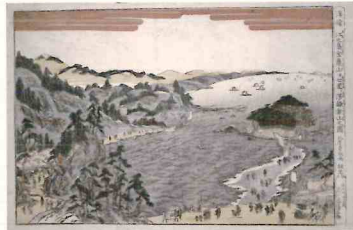
北尾重政 「浮絵江之島金亀山并七里ヶ浜鎌倉山之図」