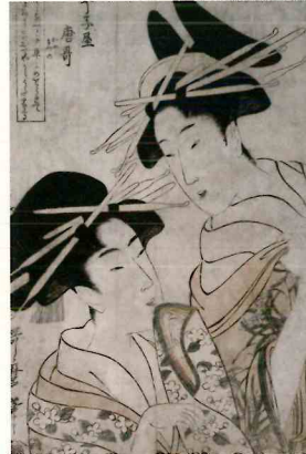
喜多川歌麿 「丁字屋唐歌」(蔦屋版)