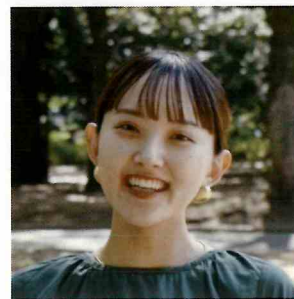
古着をバッグへ 学生団体 carutena 代表