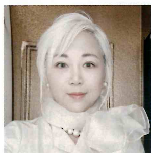
京都芸術大学 教授 環境デザイナー 鎌倉在住