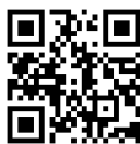
ウェブサイト 二次元コード