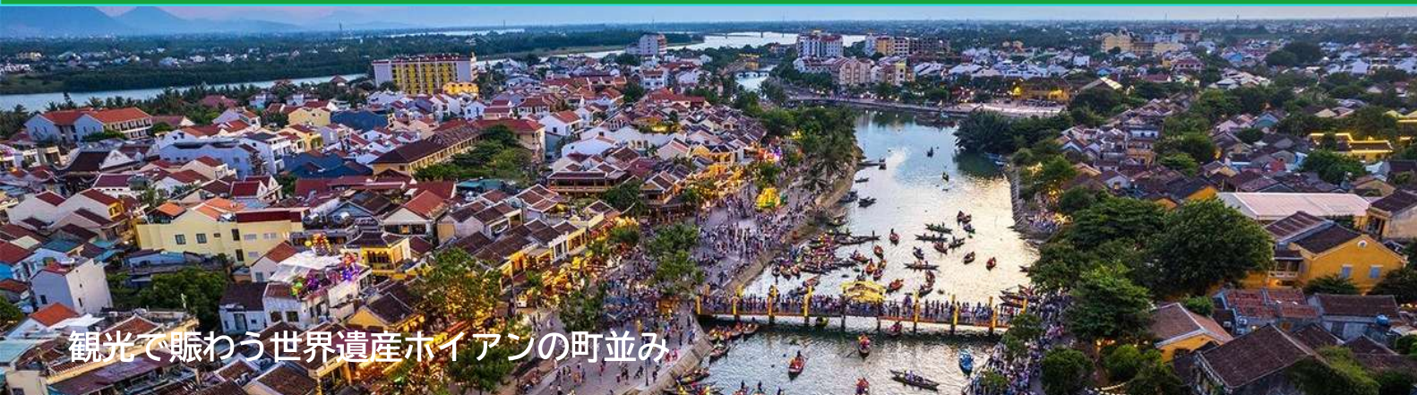
観光で賑わう世界遺産ホイアンの町並み