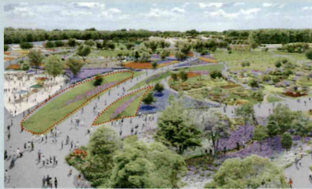
募集プランの対象地 (赤破線部 約250㎡ 長さ約90m×幅約2.5~3m)

GREEN×EXPO 2027 (2027年国際園芸博覧会) 会場を彩る 緑化プランをご応募ください。世界各国からのEXPO来場者に 対し、最初の感動を届けるメインゲート付近を対象地とし、 来場者を迎える作品を募集します。