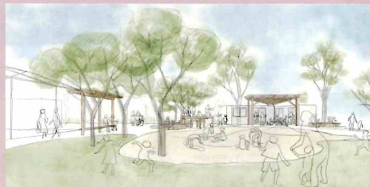
第36回 国土交通大臣賞 一般社団法人渋谷の遊び場を考える会

地域のシンボリックな緑地として人と自然が共生する都市環境の 形成、地域の活性化に寄与するプランを募集します。