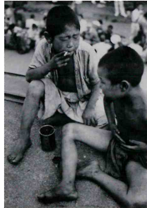
東京都・上野駅 昭和21年(1946) | 林忠彦 《煙草をくゆらす被災孤児》