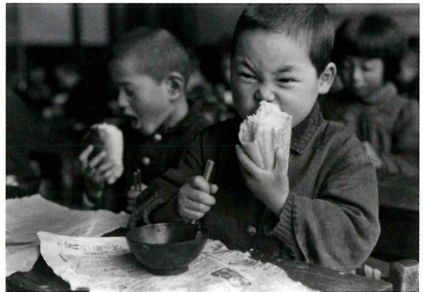
長野県・会地村 | 昭和28年(1953) | 熊谷元一 《コッペパンをかじる》