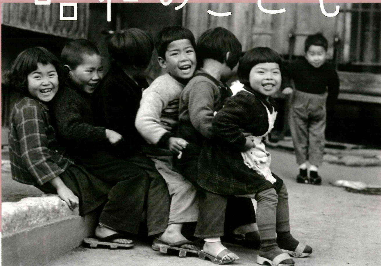
東京都・江東 | 昭和28年(1953) | 土門拳《おしくらまんじゅう》