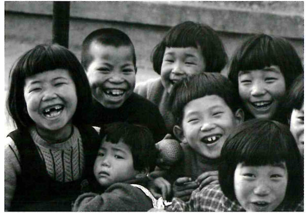
東京都・江東 | 昭和28年(1953) | 土門拳《笑う子》

昭和の歩みをたどり、私たちが生きる現在、そして未来へとつながる平和な社会について考える機会となることを願っています。